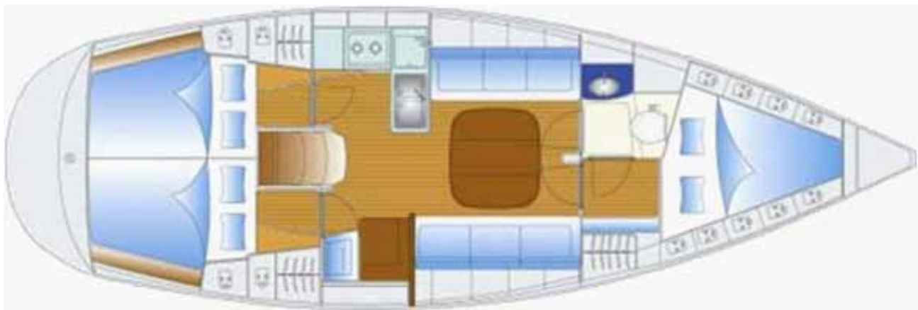
lunghezza mt 11,40