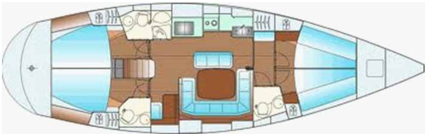
lunghezza mt 14,68